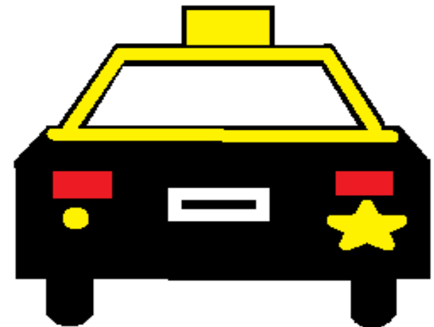
LUCES DE GIRO